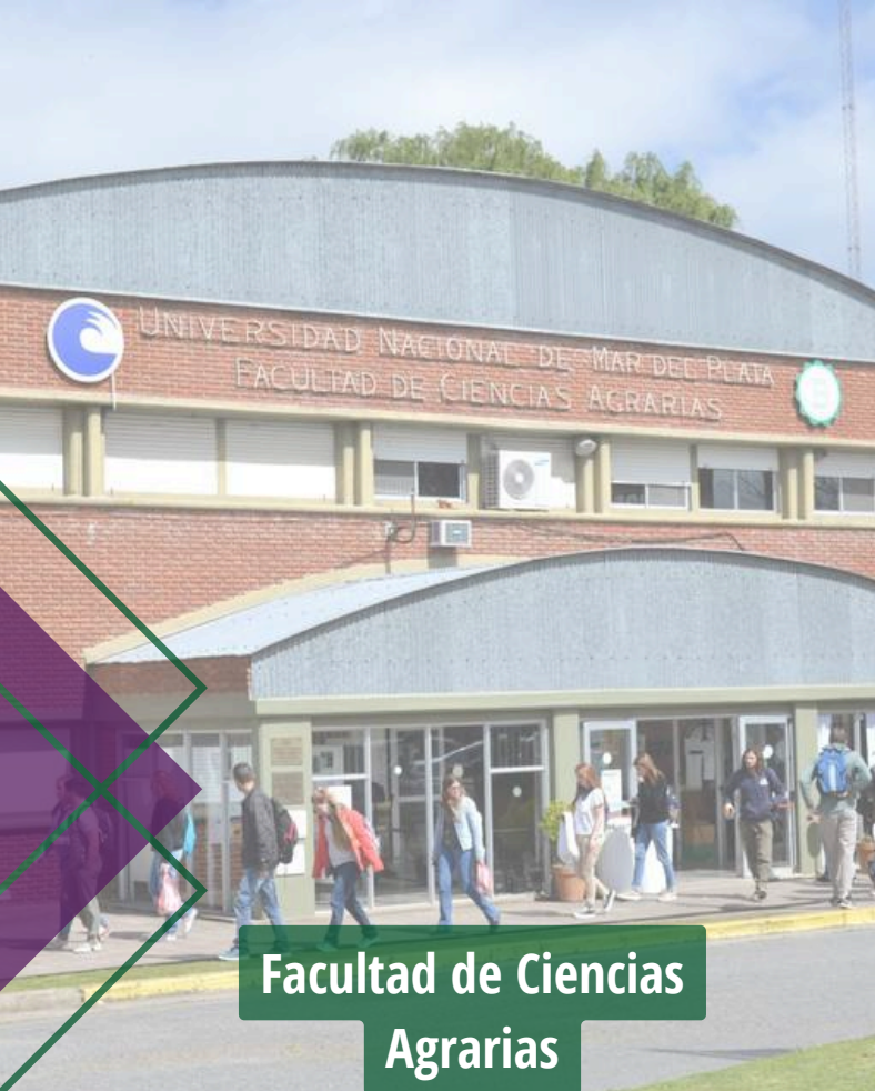
Facultad de Ciencias Agrarias